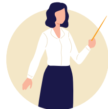
Trainingen en workshops